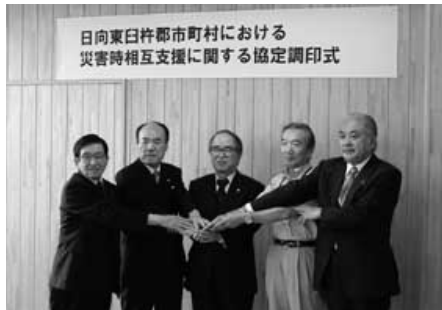
日向東日杵郡市町村における 災害時相互支援に関する協定調印式

去る7月20日に、日向市役所において日向市、門川町、美郷町、諸塚村、椎葉村の1市2町2村による災害時相互支援に関する協定が結ばれました。 これは、広域的な災害対策の取組の一環として、災害時におけるより迅速かつ細やかな相互支援を行うために、1市2町2村が協議して必要性がある場合に相互に支援を実施するという内容の協定であります。