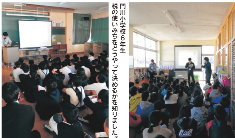
門川小学校6年生 税の使いみちをどうやって決めるかを知りました。

次の世代を担う児童の皆さんが税について関心を深め、税の意義や役割を正しく理解していただくため、1月18日に草川小学校、1月25日に門川小学校を税務課の職員が訪問し、皆さんと一緒に税の勉強をしました。 当日は、「税金はなぜ必要か」「税金は何に使われているか」を考え、税の仕組みや大切さを学習していただきました。 草川小学校6年生 寸劇により税がなくなったらどうなるかを知りました。(オーブンスクールでの開催)