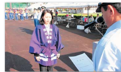
株式会社松澤組 認定年月日(平成30年6月24日)