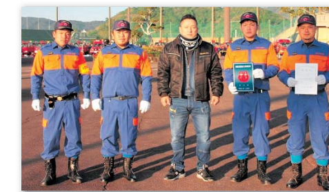
有限会社Sunlife宮崎 認定年月日(平成31年1月4日)