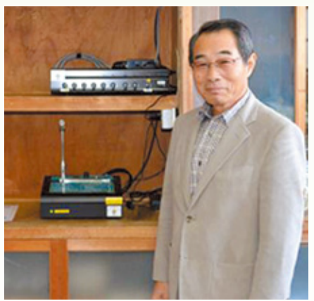
公民館内に設置の放送機器