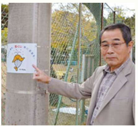
公民館敷地内に設置した拡声器付電柱と事業に係るシール