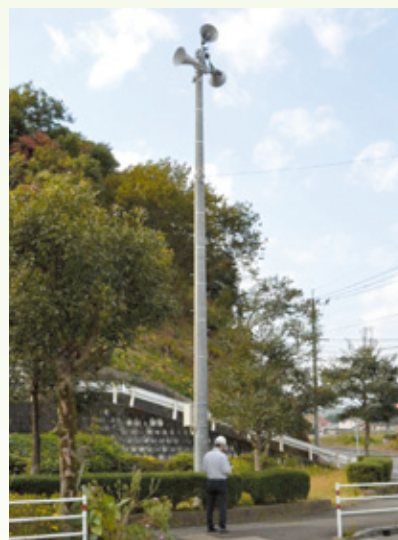
平城登り口に設置した放送機器等

財団法人自治総合センターのコミュニティ助成事業を受けて、今年度は西栄町自治会の放送施設が整備されました。 これは、宝くじの普及広報事業の一環として、地域コミュニティ活動の促進や、地域社会の健全な発展を図る目的で行われている事業です。 これにより、同地区での地域づくりやコミュニティ活動(地域住民のふれあい)が一層促進され、また防災の面からも迅速で正確な情報の伝達ができるものと期待されています。