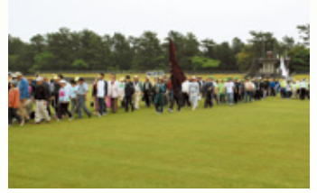
今年度の大会の様子

※大会当日の申し込みは、運営上、受け付けられませんので、ご了承ください。 ※当日は、報道機関も来場いたします。 福祉課 地域福祉係