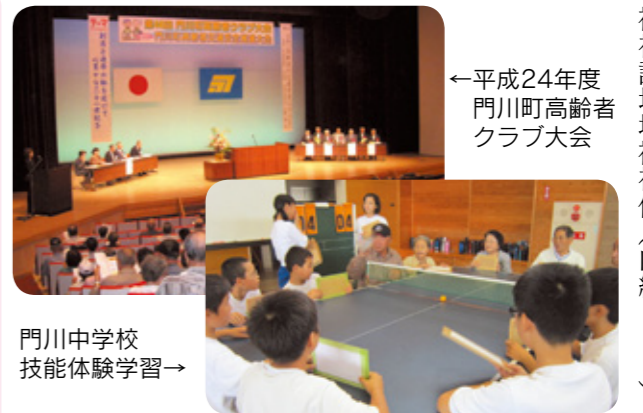
←平成24年度 門川町高齢者 クラブ大会