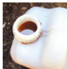
←抽出された 木酢液