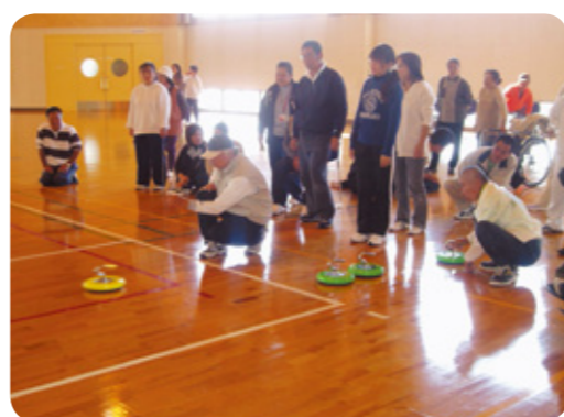
平成21年度スポーツ教室(カローリング)

★参加選手及び選手の介助をしていただける、ボランティアを募集しています!平成24年9月13日（木）までに電話連絡等にて申し