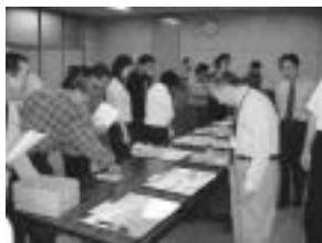
ポスターの審査風景