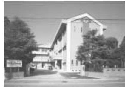
完成した門川中学校校舎