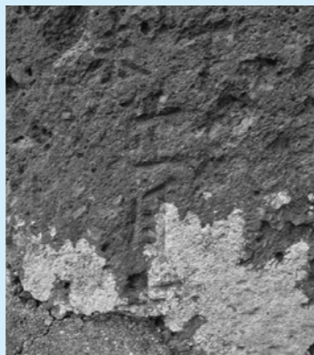
左から未丁 その下に十一月

外の文字は読み取れていません。丁はひのと、未はひつじで、十二支の組み合わせのひとつで、甲子から始まって44番目になります。元号は読み取れませんが、年代は不明です。江戸時代のはじめから半ばくらいに造られたのではないかと思います。