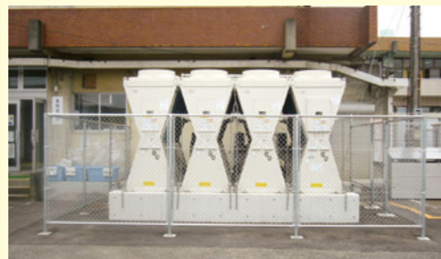
省エネ設備に更新した役場庁舎の空調設備