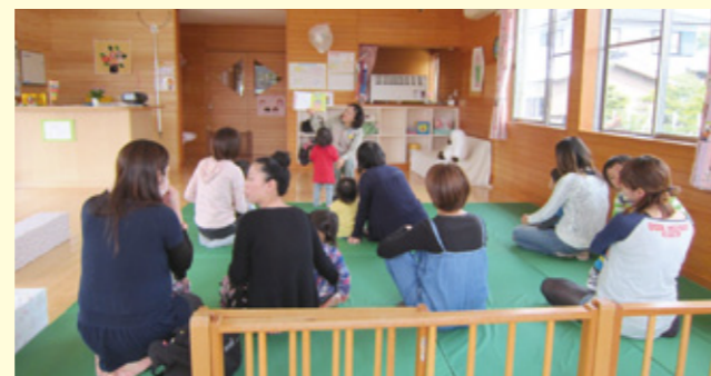
平成24年2月開設子育ての拠点「子育て人づくりセンターひだまりハウス」