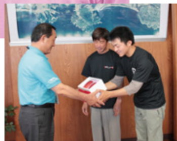
6月18日には完熟マンゴーを門川町長に贈呈。品質や栽培方法の難しさなどを説明した。