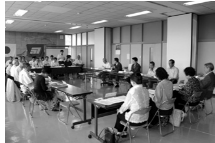
平成24年5月18日審議会