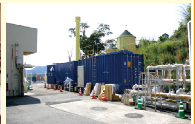
「かどがわ温泉心の杜」地球環境にやさしいエネルギー利用のためペレットボイラーを設置(本年度竣工予定)