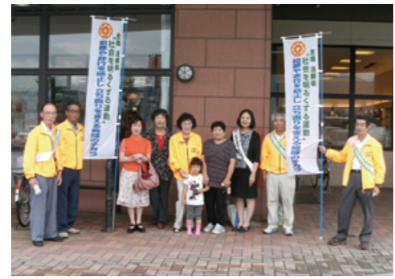
延岡地区保護司会門川支部会の街頭啓発(平成23年度)