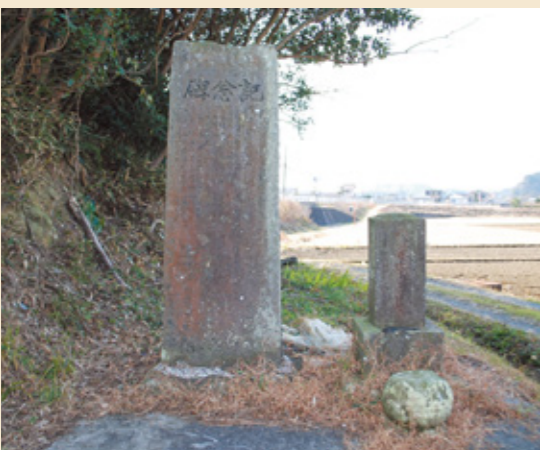
左: 明治43年改堀記念碑 右: 享和三年の供養塔

その和七の功績を後世に残し、供養のために、隧道の上の山に建立されたのが、この供養塔である。現在は、丘陵の南東の端を掘りきって県道土々呂日向線に抜けていた道が拡幅されたため、山の上にあった供養塔は、道のわきの水路のそばの空き地に移設されている。