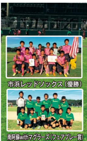
市浜レッドソックス(優勝) 南阿蘇withマガラズ(フェアプレー賞)