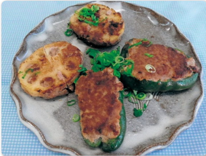
1人当たり：野菜 約50g (目標の約1/7の野菜がとれる!!)