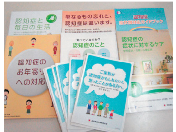
(上写真) わかりやすく、短時間で読める認知症のパンフレットを多数準備しています。図書館に立ち寄り、お持ち帰りください。「オレンジカフェ」や「認知症の人と家族の会」の情報もあります。