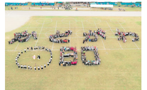
町民体育大会「町制施行80周年記念人文字」

①西門川児童館の見直しについて、西門川小・中学校の動向や児童の数を踏まえて、今後の方向性を検討するようにしています。