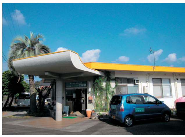
門川町東栄町2丁目2-1 小規模多機能ホーム こぼる別館 特定非営利活動法人 かどがわ・ざわざわ会 TEL.0982-63-7771