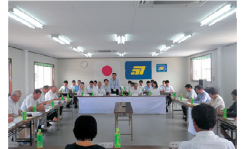
平成28年7月28日審議会開催

今後とも、限られた財源の有効活用により、「町民一人ひとりがこの町に生まれ・この町に育ち・この町で生きてきたこと」に喜びを感じとれる事を念頭におきながら、「選択と集中」の時代認識に立ち、町政を「もっと前へ、さらに前進」させていくよう全力をあげて取り組んで参りますので、ご理解とご協力をお願いいたします。