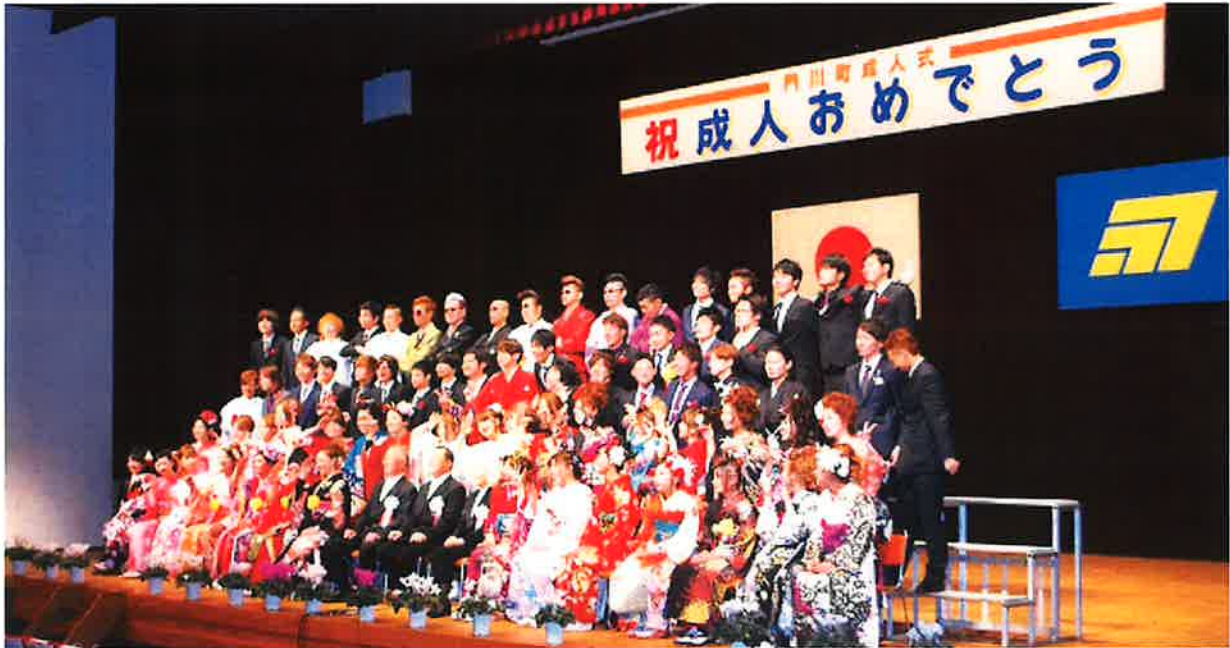
記念写真撮影風景

華やかな振袖や袴、スーツに身を包んだ新成人は、旧友との再会を懐かしむとともに、式典では中学校時代の恩師からのビデオメッセージなどもあり、未来への決意を新たにしていました。