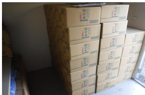
心の杜備蓄倉庫の保存水