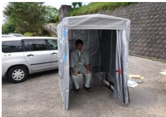
2016年4月に発生した熊本地震後に寄贈された車椅子対応型の組み立て式簡易トイレ