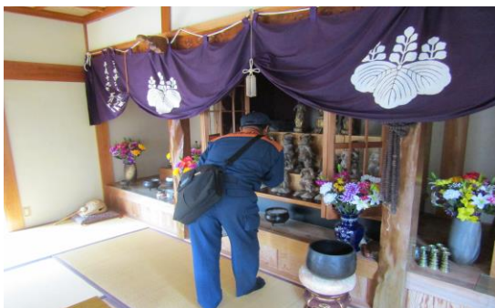
防火週間における日向消防署による文化財立ち入り調査