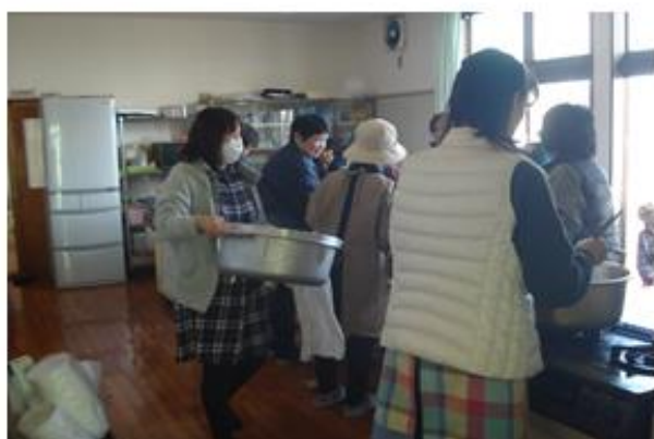
自主防災組織による炊き出し訓練