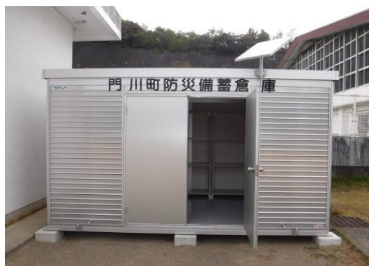
五十鈴小学校備蓄倉庫