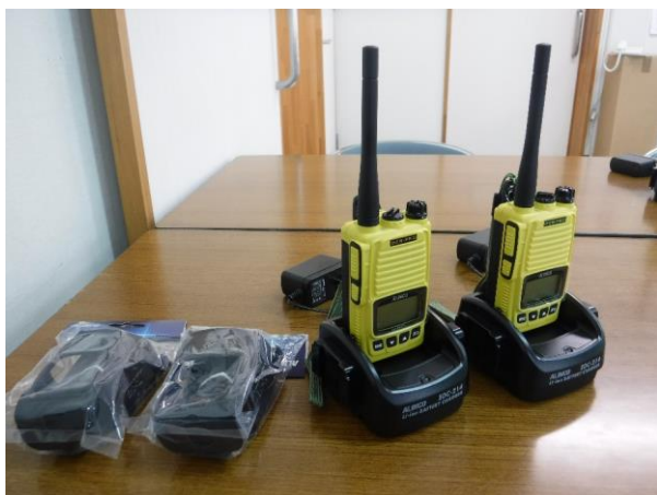
防災組織で導入されたトランシーバー