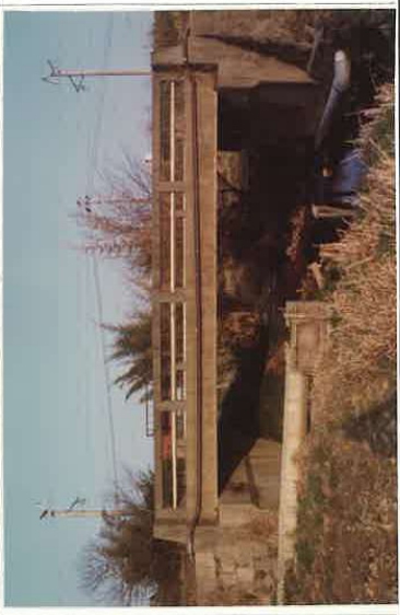
S = 1 : 100