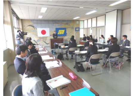
平成26年度委嘱状交付式

はじめに、本年度の6名の研究員に委嘱状が交付されたあと、第1回の研究員会を行いました。新原所長からは、研究員への激励の言葉とともに、本年度は、昨年度取り組んだ「キャリア教育」の研究をもとにして、門川の子ども一人ひとりに確かな学力を保証するための「学力向上」の研究に取り組んでほしい、という話がありました。