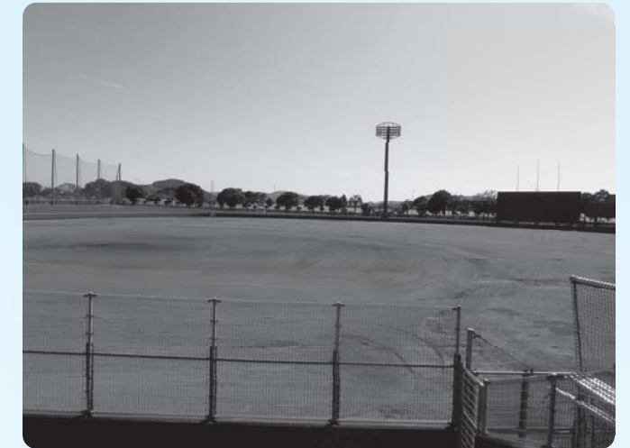
門川海浜総合公園野球場