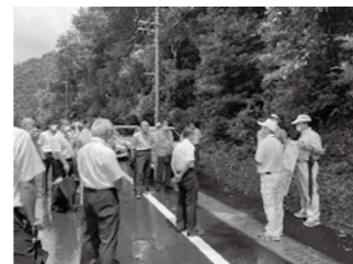
国道388号視察の様子