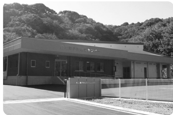
▲門川町学校給食センター

町長 大規模災害時に今回新設した給食センターの活用が非常に重要となってくるが、緊急時の発電機容量は足りているのか。