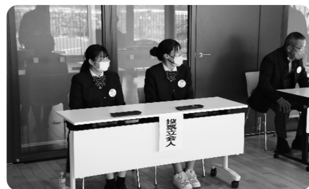
▲門川高校生投票立会人

町長 乙島は、国の林野庁所有となっており、西側の平地部分は、漁協関連施設で県の所有となっている。国や県に相談しながら、許可を受けて整備を行なっている。そのようなことから、今後、将来的に町で購入することで、どのような費用対効果があるのかも含めて前向きに、国や県の関係機関と協議を進める。