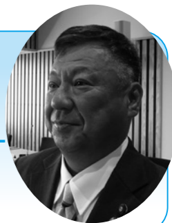
田中 豊和 議員