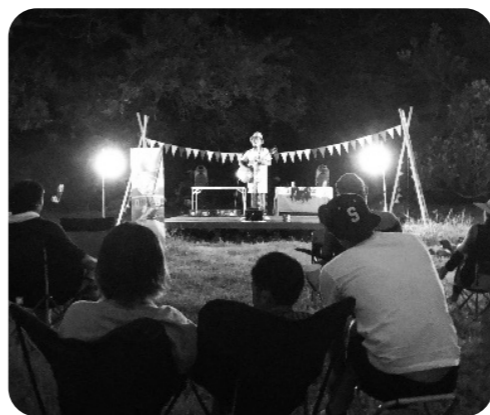
▲ミュージックキャンプ

町長 ファミリーフィッシング大会やミュージックキャンプなどのイベントも開催し、町内外からの観光客誘致や乙島キャンプ場のPRに努めるとともに、今後は観光協会と連携し、体験型観光の取組みの強化と、SNSを活用したPRや企業の研修の場、子供達の教育の場としても、活用して行く。