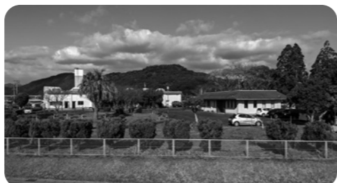
▲門川町衛生センター

町長 衛生センターに通じる道路整備についても、建設課と協議を図りながら進めていきたい。