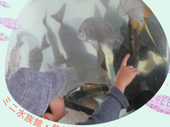
ミニ水族館・釣り堀