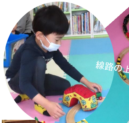
線路の上をなが〜い電車が走ります