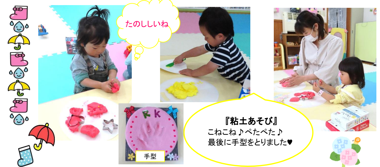
『粘土あそび』 こねこね♪べたべた♪ 最後に手型をとりました♡