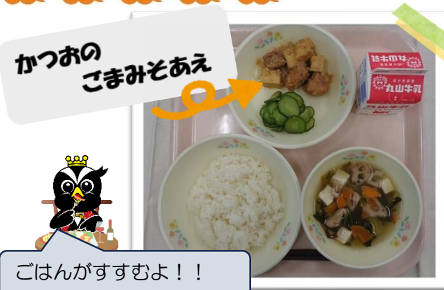
ごはんがすすむよ！！