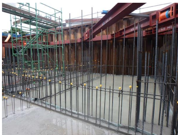
地下底盤部分の配筋及びコンクリートの打設を行いました