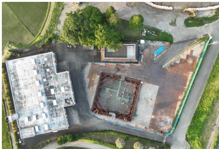
地下階の掘削工事が終わりました