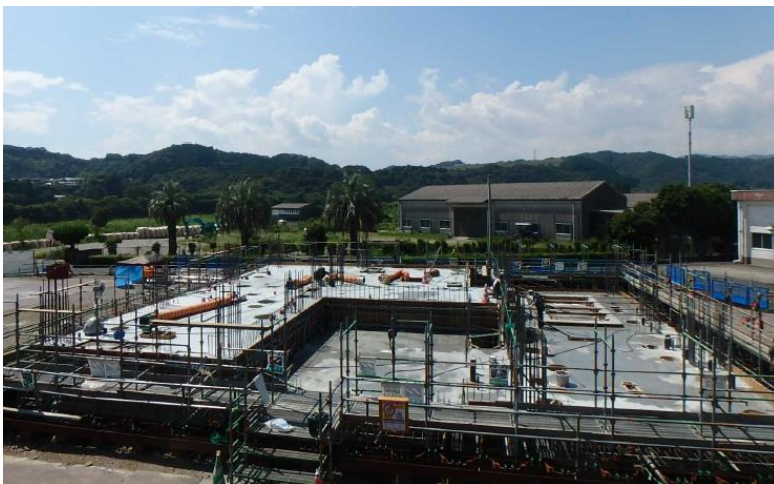
処理棟側1階の梁・スラブまでコンクリート打設が完了しました