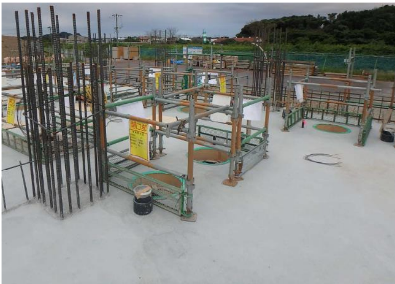
円形の穴部分が水槽の開口部になり、し尿処理の各工程で使用する水槽が地下に設置されています