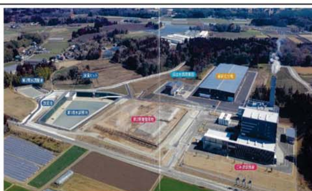
・クリーンの森合志 全景（パンフレットより）