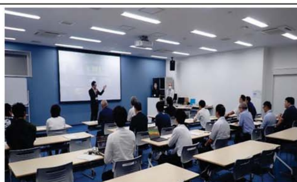
・会議室での映像研修及び意見交換会の様子