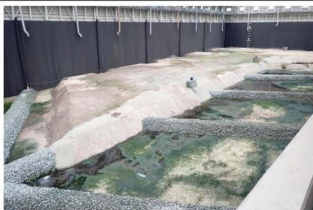
・処分場内部（埋立状況）