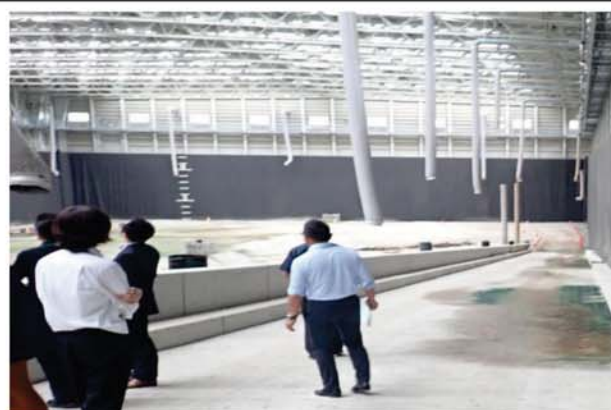
・処分場内部視察時の様子