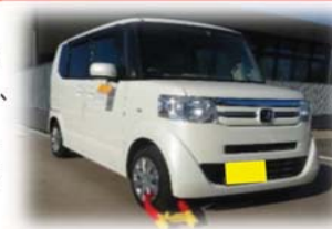
(↑タイヤロック中の車)

そこで、町では納期限内に納付が無い人に対して、督促状や催告書、電話等により自主納付を促しています。それでも納付が無い場合は、財産調査のうえ差押を行います。