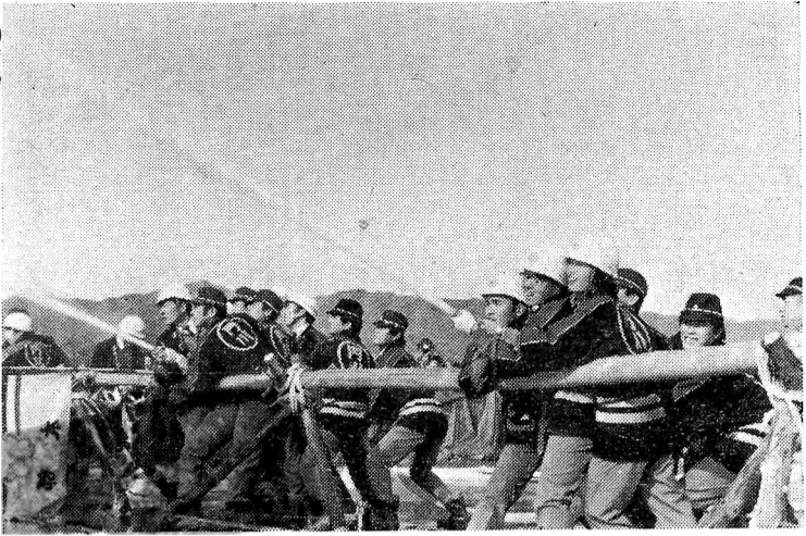
消防始式に際し、消防団員が放水訓練を行っている様子。

県下のトップを飾る本町消防始式は、新春の四日、大漁旗のひるがえる門川漁協立地で開催されました。身も刺すような寒風にもめげずハッピー姿を身をかためた消防団員五百名は、開会式の午前八時には勢揃いし、定刻通り威風堂々の分列行進より開始されました。 ついで国歌斉唱、点検長(町長)挨拶があり、消防本部(役場職員)より順次各部毎に地区住民の生命、財産を守る消防団員として、必要な人員、装備、訓練が出来ているか等について審査がなされる通常点検が行なわれ、昨年全国大会出場、宮崎県一の栄誉に輝いた門川町消防団の名譽にかけ日頃の消防精神、規律訓練の成果を遺憾なく披露し、その結果、左記の部が入賞しました。 次いで約一時間に亘る放水訓練に先立ち明治五年購入された現在南町に保存されている「腕用ポンプ」による「ちようちん」落しが行なわれ、今だにその性能の衰えを知らぬポンプに団員はもとよりつめかけた住民の方々の賞賛を受けました。 又昨年新たに配置された第七部、第二部の積載ポンプ自動車、第一部の積載車を始め現在、町村では最高の消防機動力(消防車八台、小型動力ポンプ付積載