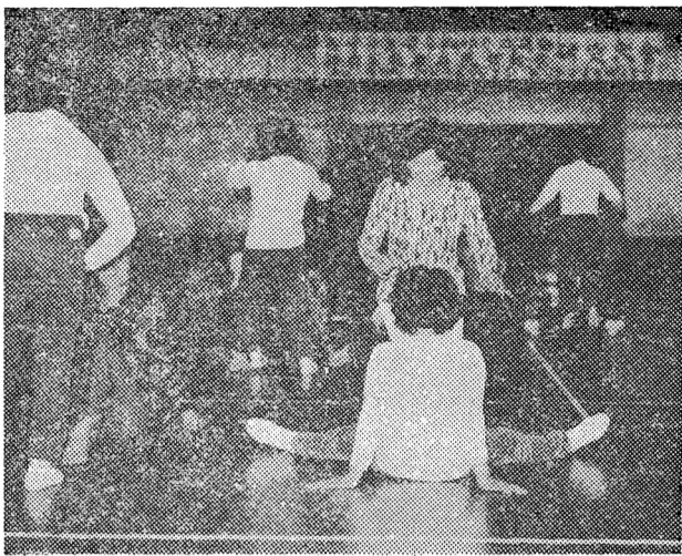
スポーツ教室風景

町教育委員会では新年度も次のような学級を開設し皆さんの参加を待ちたいとありますので、ふるつてご参加下さい。