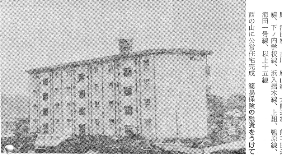
西の山公営住宅(総事業費138,122千円のうち52,800千円の融資)