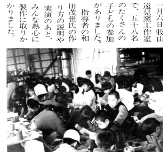
楽しい中に真剣な取り組みをしている参加した子どもたち

この日のために、地元の保存会や子ども会育成者の方に指導を受け、けい古を重ねてきたとあって素晴らしい踊りをステーションに繰り広げ、参観者から盛んな拍手をいただきました。