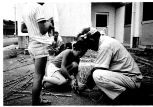
おじいちゃん いろんなことを 教えてくれてありがとう。

◎ 家庭の日の呼びかけ、実施について 「家庭の日」は昭和四一年に始まったところですが、一般 ◎ 又、としよりと子供のふれあい作業では、老人クラブと子ども会の皆さんが、公民館に集