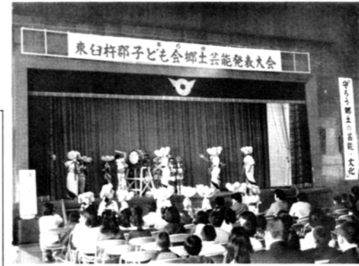
素晴らしい踊りを披露する「庵川西子ども会」