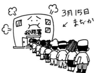
所得税の確定申告は正しくお早目に

の申告しなかつたり、間違つた申告をしたりしますと、後で不足の税額を納めるだけでなく、不足税金の十パーセント又は、五パーセントの加算税が課され、延滞税も納めなければならないこととなります。申告書は正しく計算、記入して早目に提出しましょう。確定申告のことで、お分かりにならないことがありましたら、延岡税務署(TEL〇九八二一三二一三三〇一)にお気軽にお尋ねください。