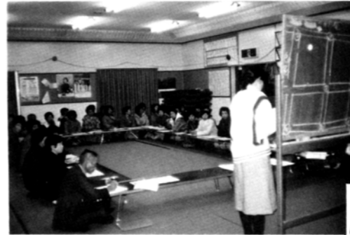
ご主人も一緒に「栄養講座」

◎ 婦人会、育成会、老人クラブ等全区民を対象にして「健康づくりの基本について」をテーマにして、役場の栄養士、保健婦さんを講師に招き、勉強致したところ、特に今回は、主人の参加が目立ち、栄養面について、認識を改めることができたと言った声が聞かれ大変有意義な講座でありました。