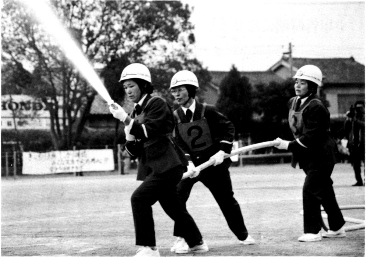
消防出初式に花をそえた婦人消防隊 (63.1.4)