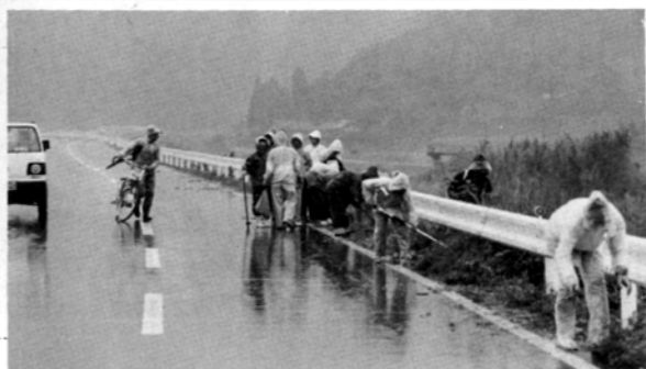
雨の中、道路美化に励む中村地区民

八月一日から八月三十一日までの一ヶ月間は、「道路を守る月間」となっており、第一日を道路愛護デーとし、県民の参加を募り、道路清掃作業等を実施しています。安全で快適な道路環境を保つため、町民の皆さんのご協力をお願いします。