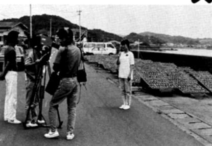
UMKサンデーみやざき収録風景