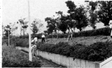
きれいになった海浜公園

道、電気業者、建築事務所並びに商工会、加草五区のミニゴルフ愛好会の方々が、日頃皆さんにご協力を、お願いすることが多いため少しでもお役にたつことができれば、との主旨から積極的に毎年町内道路の空カン拾いや河川清掃等を実施していますが、今回町民のスポーツ、レクリエーション及び憩いの場として整備が進められている海浜総合公園を皆さんに「さわやか気