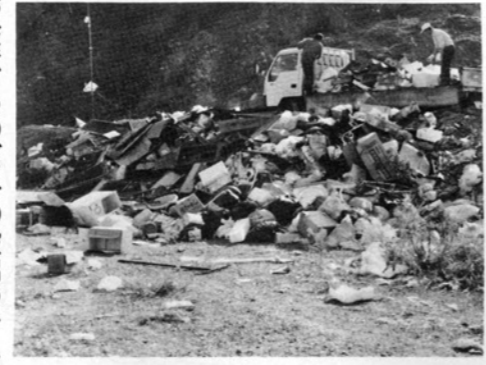
「ゴミ」は、燃えるもの、燃えないものをよく分別して出しましょう

毎年、年末には一般家庭からのごみの搬出や、し尿汲取りの申込みが増加するのが通例であります。これらごみ・し尿を円滑に処理するために、今年も次のとおり日程を定め、収集することにしましたのでお知らせ致します。