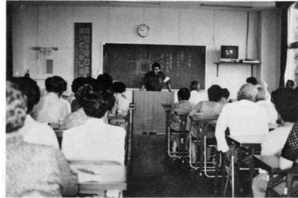
高齢者交通安全教室

年末年始は飲酒の機会が多く、また交通量の増加等により交通事故の多発が予想されるので、広く町民に「思いやり交通」を原点とした交通安全思想を普及徹底し、「止まって確認」の実践とシートベルト・ヘルメットの正しい着用を習慣づけ、交通事故防止を図ることを目的としています。