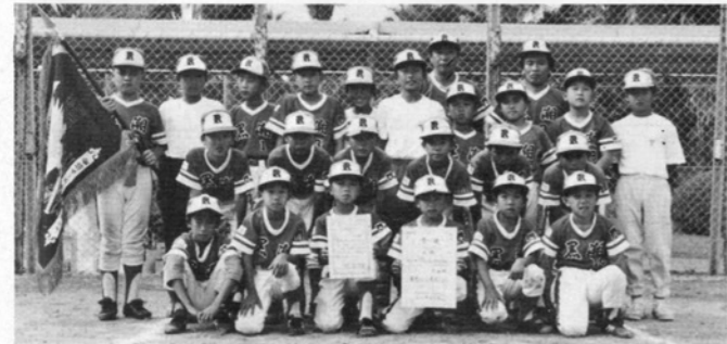
来年3月、広島県の全国大会に出場する「黒潮スポーツ少年団」