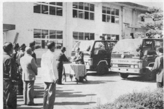
第2部・第4部に積載車