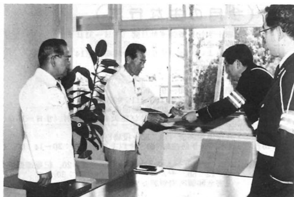
県警本部長より門川町へ祝辞が伝達される。

本町は、平成元年四月十四日をもって交通死亡事故抑止一年間を達成し、四月十七日宮崎県警察本部長より祝辞をいただきました。皆様のご協力に厚くお礼を申し上げます。 しかしながら、宮崎県全体で見ますと昭和六十三年一年間で二十五名でしたが、平成元年にはいりましてすでに二十七名と前年の死者数を越えております。 これから、暖くなり、連休にはいると車等が出かける機会が多くなります。『思いやり交通』に心がけ『ゆとりのある運転』で交通事故を防ぎましょう。