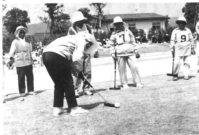
●東臼杵を代表して県民体育大会へ出場 ―女子ゲートボール―

保育に欠けている家庭の児童、一歳から就学前の児童を保育します。 住民課にて随時受け付けています。