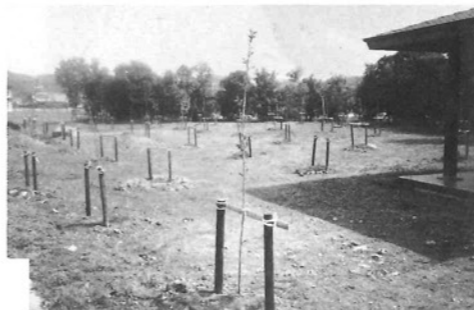
きれいに植えられた桜の苗木