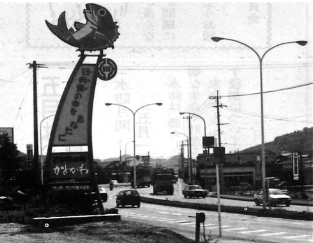
南町国道10号線沿に「観光看板、