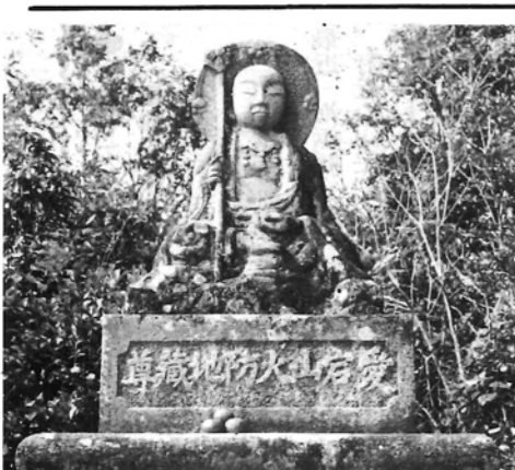
加草に古くから伝わる「火の神様、

裁判所は、憲法の番人として、憲法や法律に依った公平な裁判をすること、国民の基本的権利を守り、正義を実現し、法の支配を維持する役割を果たしてきました。 しかし、民主主義国家における法の支配を支えるについて、最も重要なのは、国民一人一人が自ら法を守るという姿勢ではないでしょうか。