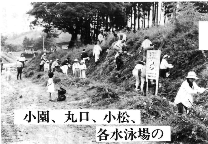
小園、丸口、小松、各水泳場の