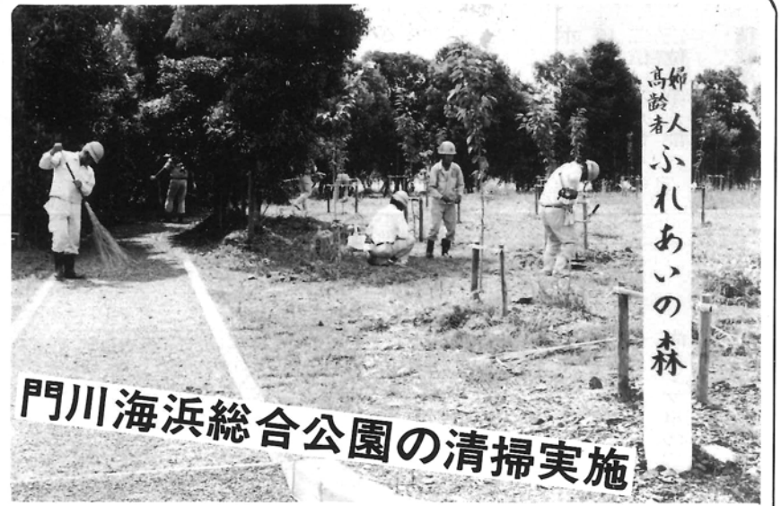
門川海浜総合公園の清掃実施

2500名の皆さんにより さる7月7日(金)、門川町建設業協会及び各種関係団体、約250名の皆さんにより、門川海浜総合公園の一斉清掃を実施していただきました。 当日は、暑い中、午前8時30分より清掃を実施し、見違えるほどきれいな公園になりました。 皆様のおかげで、7月15日にすがすがしい気分で、プール施設がオープンすることができました。清掃を実施していただいた皆様に紙面をかりましてお礼申し上げます。