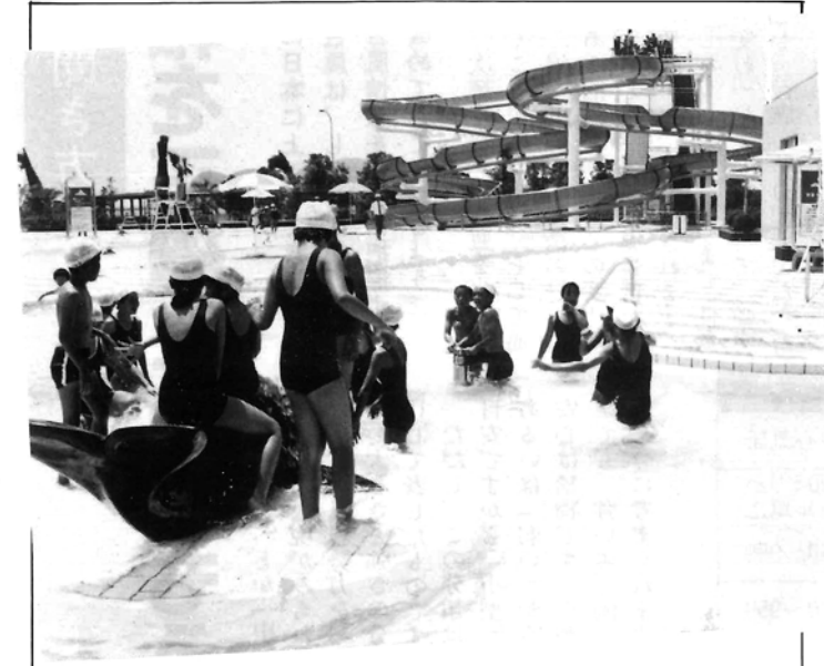
オープンした門川海浜スライダープール