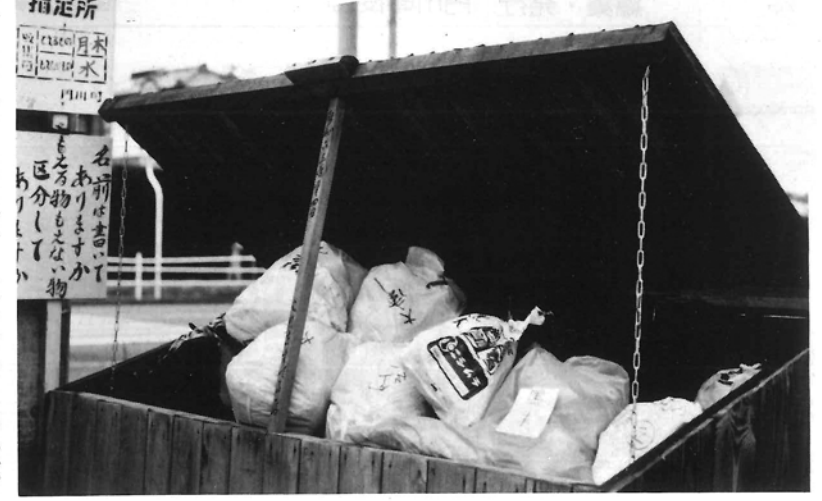
—みんなの協力で、いつも整理整頓されている収集場—

ごみの収集 盆期間中の、ごみの収集・し尿汲取りにつきましては、次のお取扱いとなりますのでご理解下さるようお願いいたします。 八月十五日(火曜日) 休ませていただきます。 ◎当日収集日になっている地域の方は次回収集日の八月十八日にごみを出して下さい。 ※清掃工場へのごみの直接持ち込みも八月十五日は休みです。