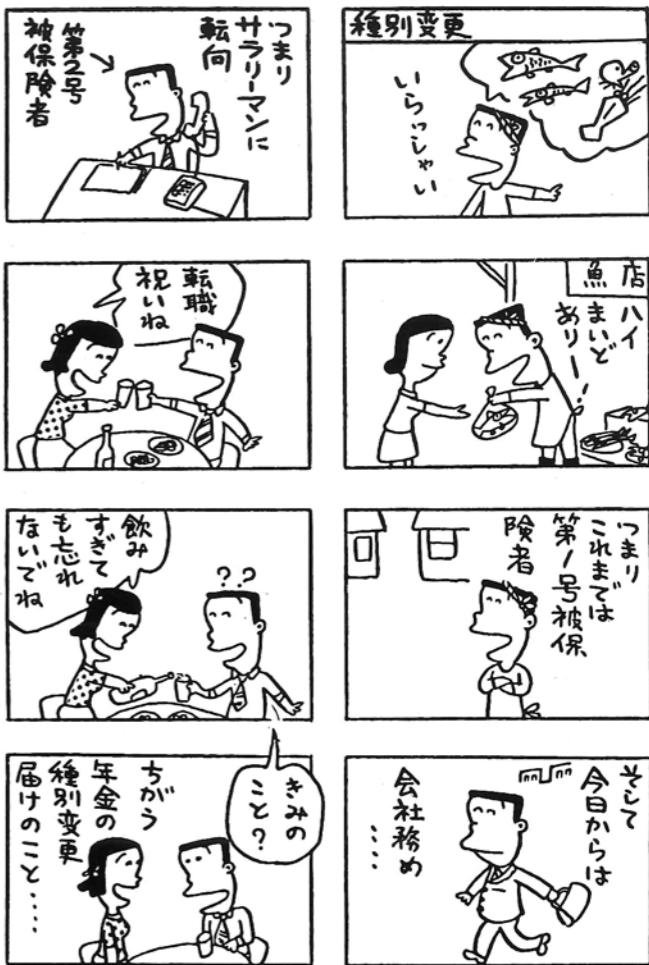
◇国民年金の加入手続きをしましょう

こうした社会ニーズへの対応と、地域の雇用開発・経済の活性化を目的としてつくられるのが「延岡コンピュータ・アカデミー」です。 この施設が設置されることにより、今まで高校卒業者の大半