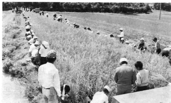
収穫の秋 (五十鈴小5年生)