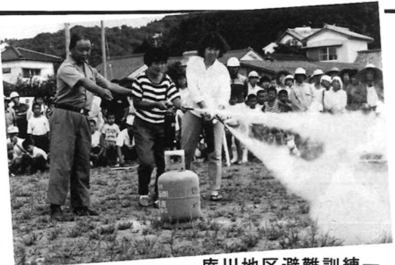
一庵川地区避難訓練(消火訓練)

その他があり、これらの手続について相談に応じています。当支部各行政書士事務所では、皆様のおしをお待ちしていますので気軽にご相談下さい。 二、にせ行政書士の排除について 上述のような手続相談は、有資格の行政書士かつ県知事認可の報酬額で安心して依頼できる行政書士事務所をご利用下さい。行政書士会員以外の者が他人の依頼を受け報酬を得て業務を行うことは法律により禁止されています。