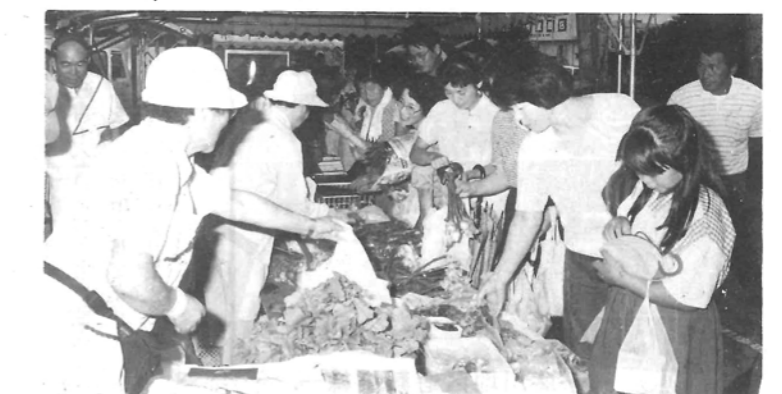
イベントのイワシ試食会やラムネ早飲み競争も、お楽しみ抽選会同様、大盛況で充実した五周年記念だったと思われま。

毎月第一・第三日曜日に開催しておりますかがわ日曜朝市も五周年を迎え、おむね地域に定着してきた感じがいたします。