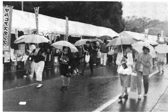
●小雨に開く傘の花／5日(日)は、小雨模様の天気にもかかわらず多くの人出で賑わった。