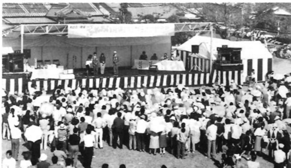
●職場対抗カラオケ歌合戦／町内の職場から12チームが出場。職場の仲間から声援や花束が…。