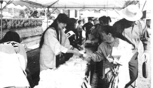
●米消費拡大コーナー／お米をたくさん食べて長生きしてくださいね。新米コシヒカリが、先着3,000名様に無料配布された。