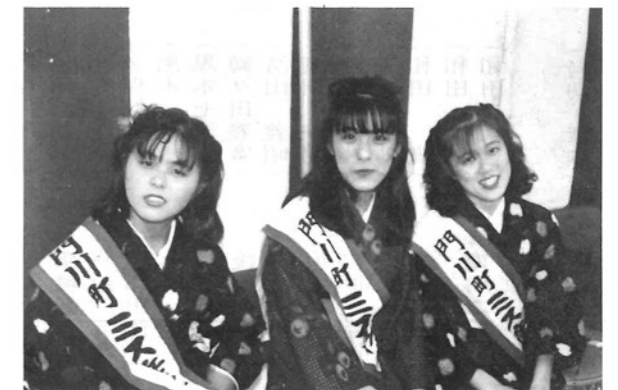
●揃って10代。3人のミス産業まつり／2日間、ほんとうにご苦労さまでした。