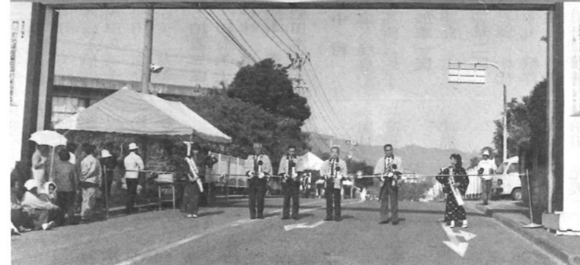
●オープニングセレモニー／「ミス産業まつり」が花を添えてテーブルカット。

会場では、農林・水産・商工の各コーナーをはじめ、ミニ水族館、子供コーナーなど今年も盛りだくさんの出店・展示に入場前には早朝から開会を待つ長い人の列ができるほどでした。 中央公民館内では、地場企業、誘致企業の製品を展示、繊維製品、家具、インテリア・カウンター等が販売され、またくらしのアドバイザーによる消費生活コーナーも好評でした。 屋外の歩行者天国の食べ物コーナー、日曜朝市コーナーでは早くから売切れ店が続出するほど。