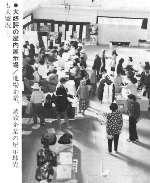
●大好評の屋内展示場／地場企業、誘致企業の屋外即売も大盛況!

会場では、農林・水産・商工の各コーナーをはじめ、ミニ水族館、子供コーナーなど今年も盛りだくさんの出店・展示に入場前には早朝から開会を待つ長い人の列ができるほどでした。 中央公民館内では、地場企業、誘致企業の製品を展示、繊維製品、家具、インテリア・カウンター等が販売され、またくらしのアドバイザーによる消費生活コーナーも好評でした。 屋外の歩行者天国の食べ物コーナー、日曜朝市コーナーでは早くから売切れ店が続出するほど。