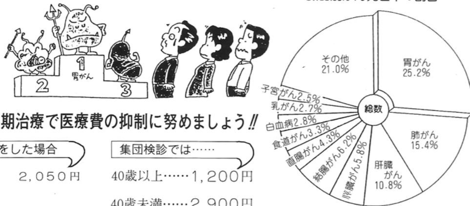
●臓器別がん死亡率の割合