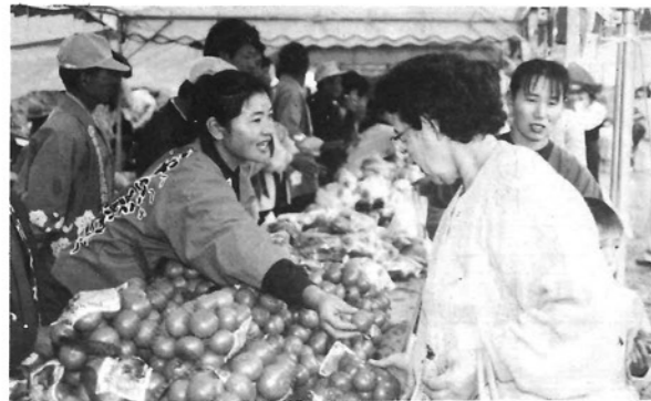
●農林産物コーナー／「奥さん、甘くて美味しいミカン、いかがですか?」