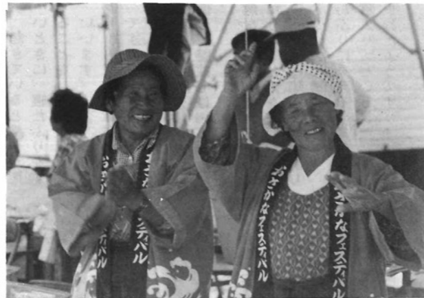
●明るい漁業の未来を願って…／「かどがわ音頭」に乗ってー。おばさん達の表情は明るい。