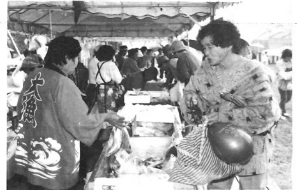
●鮮魚大安売り!／水産物コーナーも連日大賑わい。