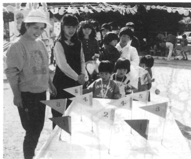
五十鈴保育所 ～園まつり～

平成二年四月から保育所に入所希望される方は、次により申請書を受付いたしますのでお知らせいたします。