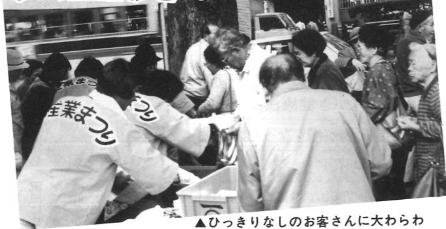
▲ひっきりなしのお客さんに大わらわ

去る12月11日～12日の2日間、県庁南別館前歩行者 通りにおいて「門川町地場産品即売会」が開催され、大盛況に終わった。