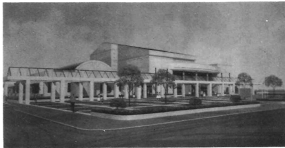
門川町産業文化会館 (完成予想図)

内需拡大政策の推進に依り、やや景気は上向きの傾向にあります。しかし乍ら国の財政窮乏は地方財政を圧迫し、本町においても苦しい財政状況の中にあります。金丸町長の賢明なご努力と、町民の皆様の深いご理解のもとに、着実に進展を見ておりますことは、ご同慶に堪えないところであります。