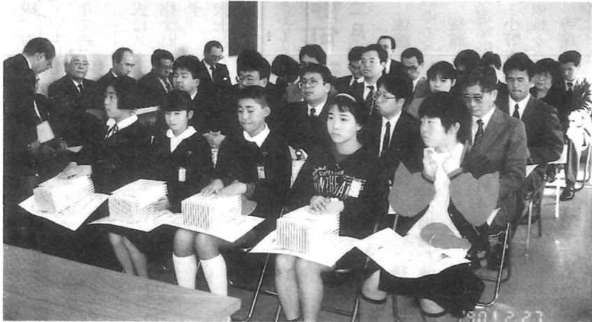
2月27日 受賞された方々