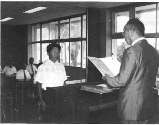
農業委員会委員/当選証書附与式

門川町農業委 員会委員の任期満 了に伴う選挙は去る七 月十日告示され、選挙すべ き定数十二名の立候補があり ました。従って定数を超え ない為無投票ということ になりました。