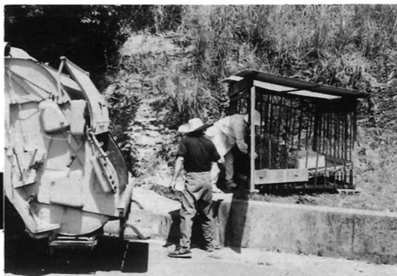
ゴミステーションはいつも清潔に!!

◎当日収集日になって いる地域の方は次回 収集日の八月二十二 日にごみを出して下 さい。 ※清掃工場へのごみの 直接持込みも八月十 五日は休みです。