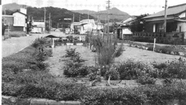
「連帯の輪づくり、花壇」加草3区自治公民館