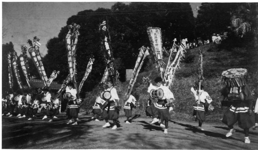
四百年前の戦の踊りは、今でも踊り継がれている。(秋祭りの日に奉納される)

小園地区に伝わる白太鼓踊りは、今から約四百年前の豊臣秀吉の朝鮮出兵(文禄元年1592、慶長三年1598)に由来しており、従軍した武士が帰国後に勝ち戦の踊りとして当地に伝えたものといわれています。