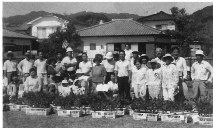
「一家一鉢」花のコンクールを終えて(宮ヶ原自治公民館のみなさん)

また、又宮ヶ原地区の住みよい地域づくりの標語を募集し、次の二点を最優秀作に選びました。 ・花の咲く心ゆたかな宮ヶ原 ・花かこみ愛と笑顔の町づくり 他にも多くの応募があり、近く地区内に看板として設置することになっております。前回にも紹介致しましたが中山川右岸の桜の木もそれぞれ班対抗で管理しており順調に成長しています。春には花が見れるでしょう。