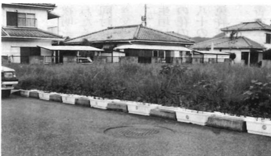
「花いっぱい運動」南ヶ丘自治公民館

町の花「サルビア」の園づくりに地区民総出で取り組んでいただきましたが、異常と言ええるカンバツで殆んどが枯死してしましました。しかし、この間区民の情熱あふれる管理体制は素晴らしいものがありました。失敗は成功のもと」ということわざがありますが、当地区は「失敗して連帯の向上更に増し」の言葉があらはまる環境が醸成された事は大きな成果であったと言ふことができます。又「一戸一品運動の手づくり文化祭」も近く、企画されていると聞きます。是非とも成功をお祈りしております。