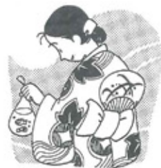
町の人口 6月1日現在