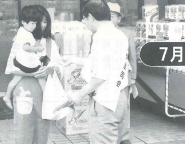
街頭で啓発チラシを配布

“社会を明るくする運動”は、すべての国民が犯罪の防止と罪を犯した人たちの更生について理解を深め、それぞれの立場において力を合わせ、犯罪のない明るい社会を築こうとする全国的な運動です。