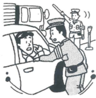
年末の犯罪・事故の防止

12月20日～1月10日 ●運動の重点 飲酒、暴走、過労、居眠り運転 年末・年始は、忘年会等に 伴う飲酒運転、若者の暴走行