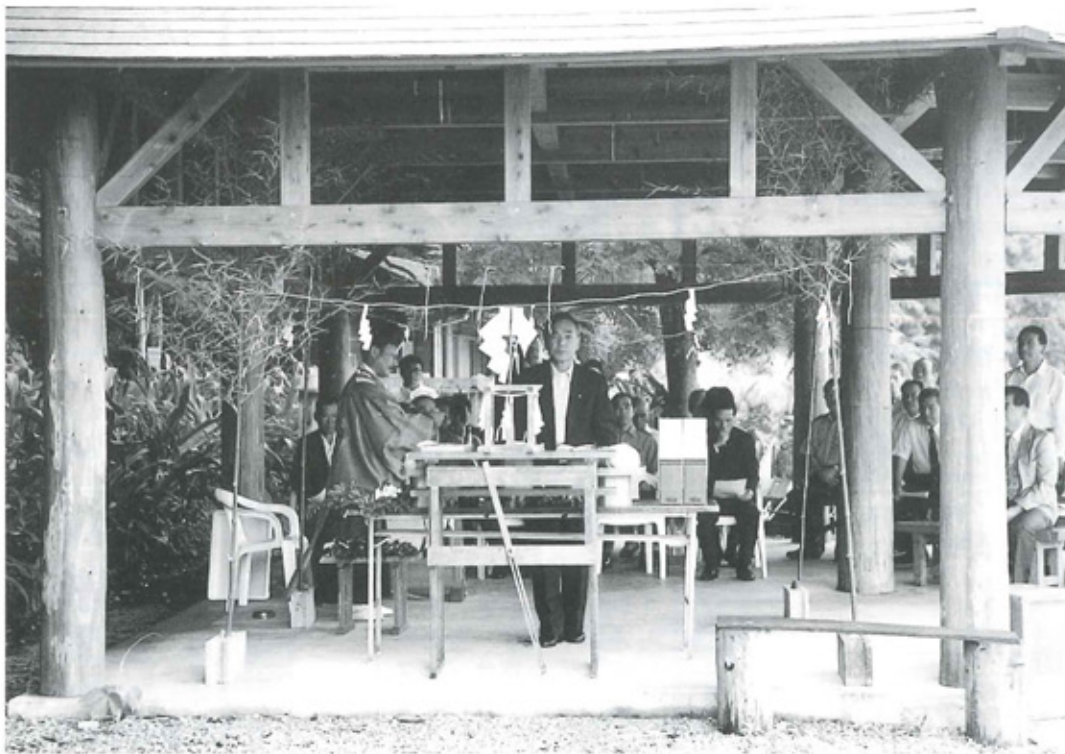
乙島キャンプ場 島開き祈願祭（平成11年7月2日）