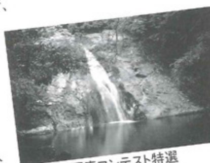
前回写真コンテスト特選