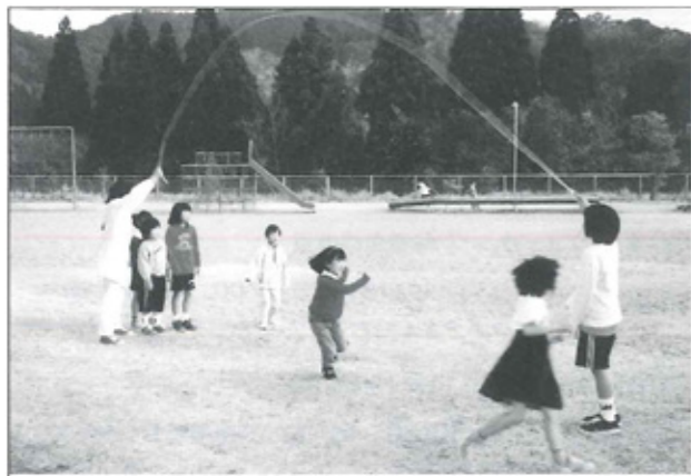
五十鈴児童クラブ