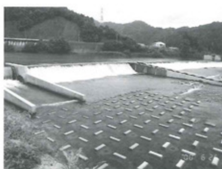
休止される小園井堰

このため、今年の遊泳場開設のあたり、現地調査を実施し、検討の結果、平成12年度の「小園遊泳場」は町指定を解除し、未開設(休止)となりましたので、お知らせいたします。