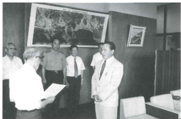
指定書を受けとる地区会長

新ひむか地域安全モデル地区とは、犯罪、事故及び災害に遭いにくい安全で安心に暮らせる町づくりをめざすためのモデル地区のことで、今回は西栄町が平成12年6月から平成15年3月の期間指定を受けました。今後の活動では、「自分たちの地域の安全は自分たちを守る。」というスロークーガンのもと、門川町や警察といった行政機関等の支援の下に様々な活動を進めていきます。