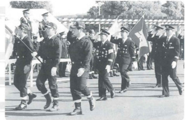
分列行進をする団員達

また、今年の分列行進につきましては、行進曲の録音を「門川中学校吹奏楽部」のみなさんにご協力をいただきました。ありがとうございました。