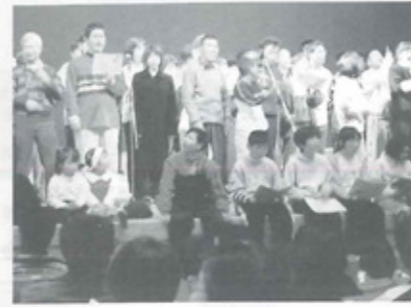
昨年のわくわくドキドキ音楽会より

【日時】2月17日(日) 12:30開場 13:30開演 【場所】門川町総合文化会館(大ホール) 【入場料】賛同券 高校生以上 500円 小中学生200円 【問い合わせ】わくわくドキドキ音楽会実行委員会事務局(社会福祉法人 門川町社会福祉協議会) ☎(63)7210