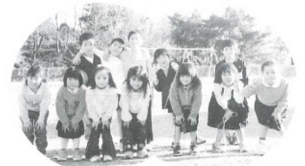
五十鈴児童クラブ