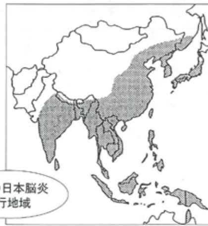
世界の日本脳炎流行地域

南アジア・東南アジア（朝鮮半島・中国大陸・台湾・ベトナム・タイ・マレーシア・インド・ネパール・ミャンマー・スリランカ）では、地域流行や全国流行が今も発生しています。東南アジア方面への旅行者や長期滞在者には、日本脳炎の予防注射が勧められている地域もあります。