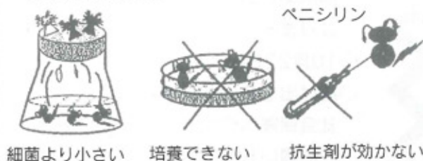
細菌より小さい 培養できない 抗生剤が効かない