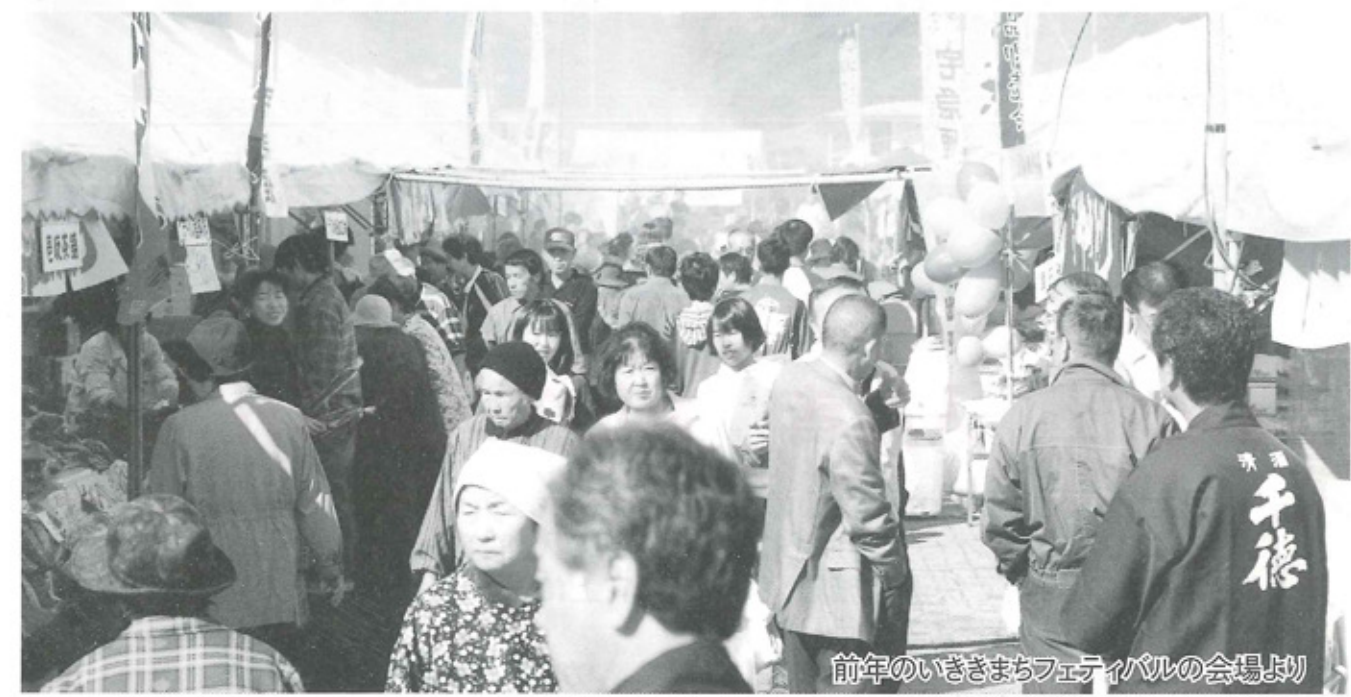
前年のいきいきまちフェスティバルの会場より

門川町地場産業振興対策協議会・門川町商工会・門川町文化協会・門川町教育委員会・(財)門川ふるさと文化財団