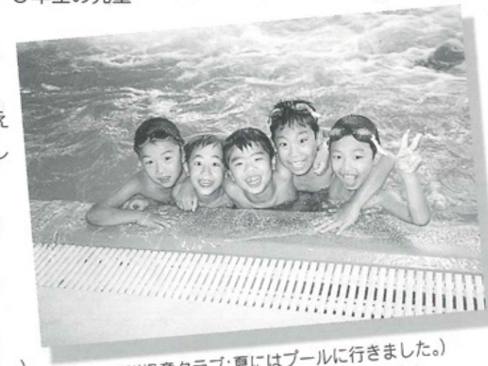
(門川児童クラブ:夏にはプールに行きました。)