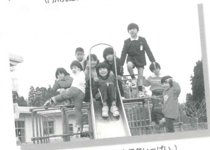
(五十鈴児童クラブ:冬でも元気いっぱい。)