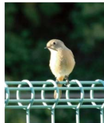
図書館に来ていたジョウビタキ(メス)

参考文献『ぱつと見わけ観察を楽しむ野鳥図鑑』石田 光史／著 『総合百科事典ポプラディア 8 第3版』ポプラ社／出版