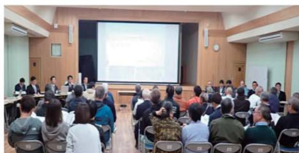
住民説明会の様子