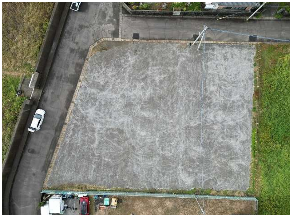
参考写真 南西方向から